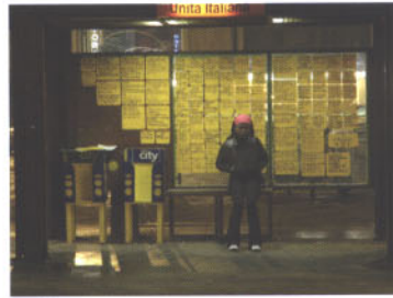
arabeschi di latte