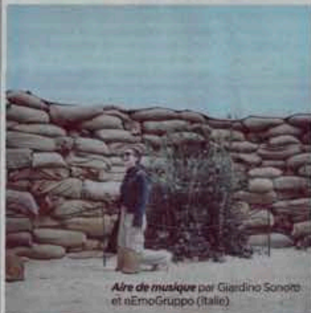
Aire de musique par Giardino Sonoro et nEmoGruppo (Italie)

Mais souffler n'est pas forcément jouer! Cette thématique a toujours été contenue dans les jardins successifs de Chaumont, qu'ils aient été débordants de mosaïque, d'érotisme, de chaos, de mauvaises herbes, de mémoire... Le jeu est inhérent au jardin comme un indispensable pléonasme. S'il ne se combine pas à d'autres réflexions et prospections, il s'aplatit comme autant de damiers, de jeux de l'uis, d'ébecs, de toupies ( Toupillo-nes ) de bac à sable ( Imaginoir ) ou comme une Marelle d'eau , sur laquelle les enfants, certes, se feront un malin plaisir à sauter et s'éclabousser. Dans ce registre de la transposition du jeu de société, le boulier Flower'n'Roll , solitaire géant,