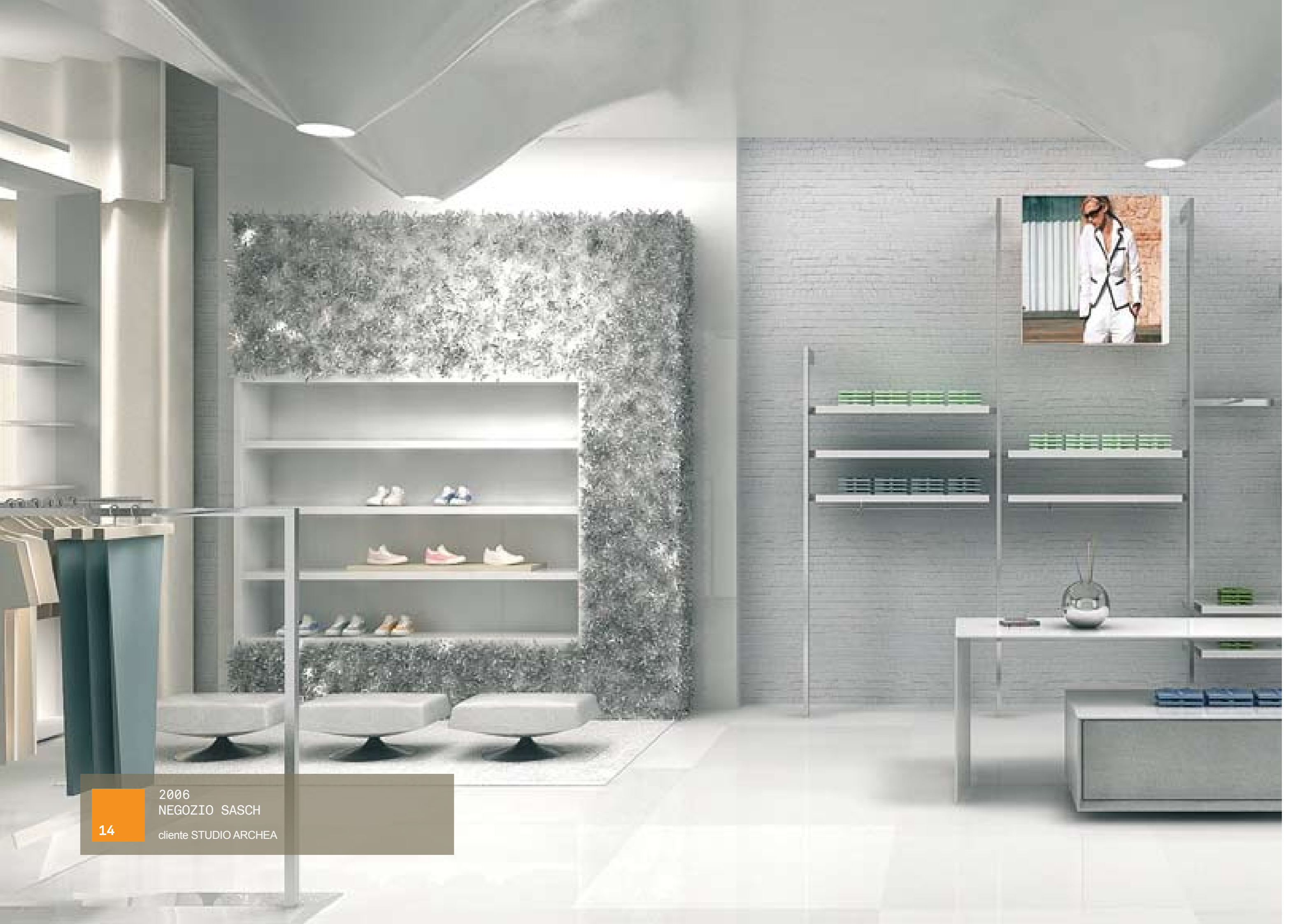
14 2006 NEGOZIO SASCH cliente STUDIO ARCHEA