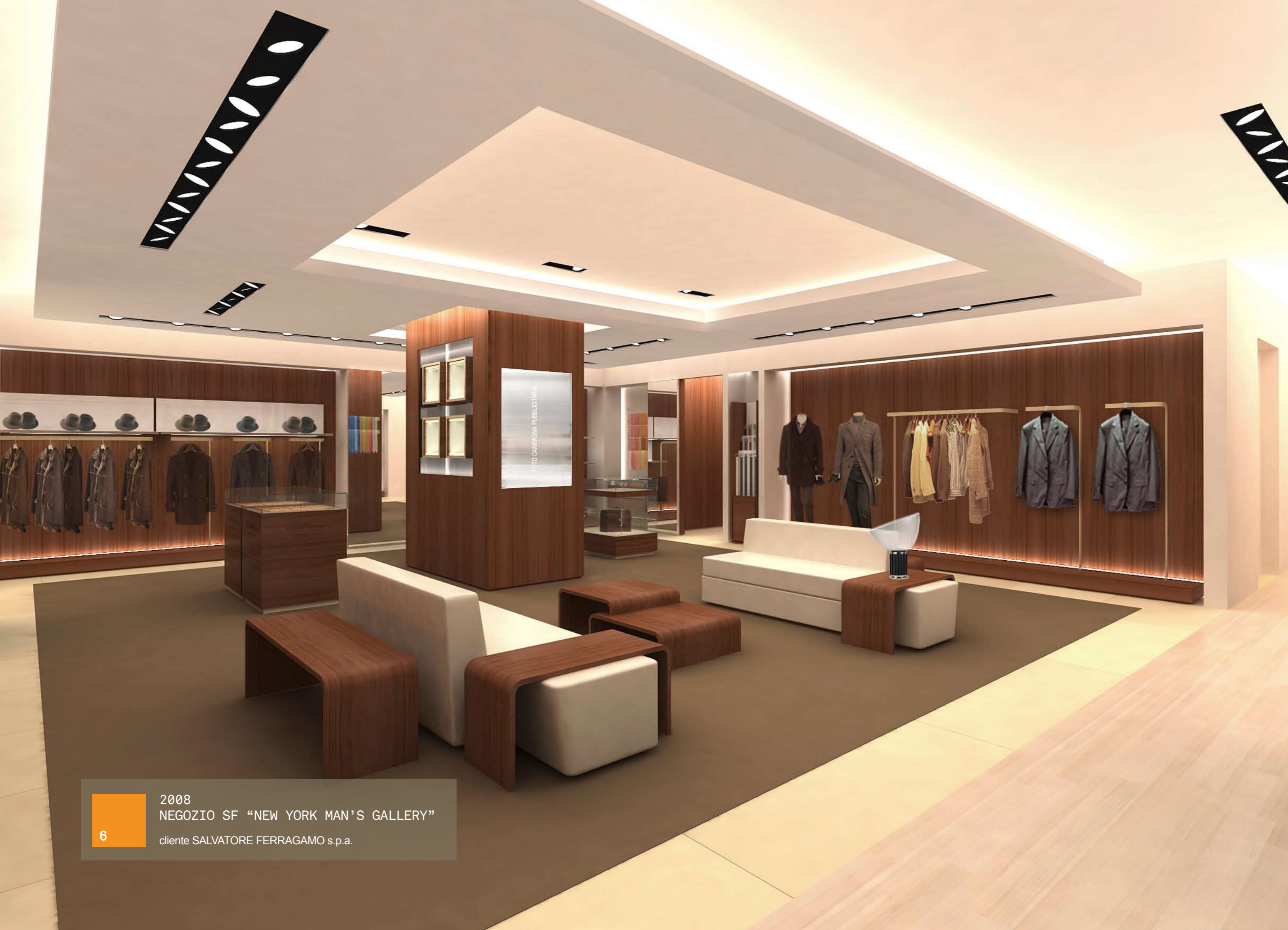
6 2008 NEGOZIO SF "NEW YORK MAN'S GALLERY" cliente SALVATORE FERRAGAMO s.p.a.