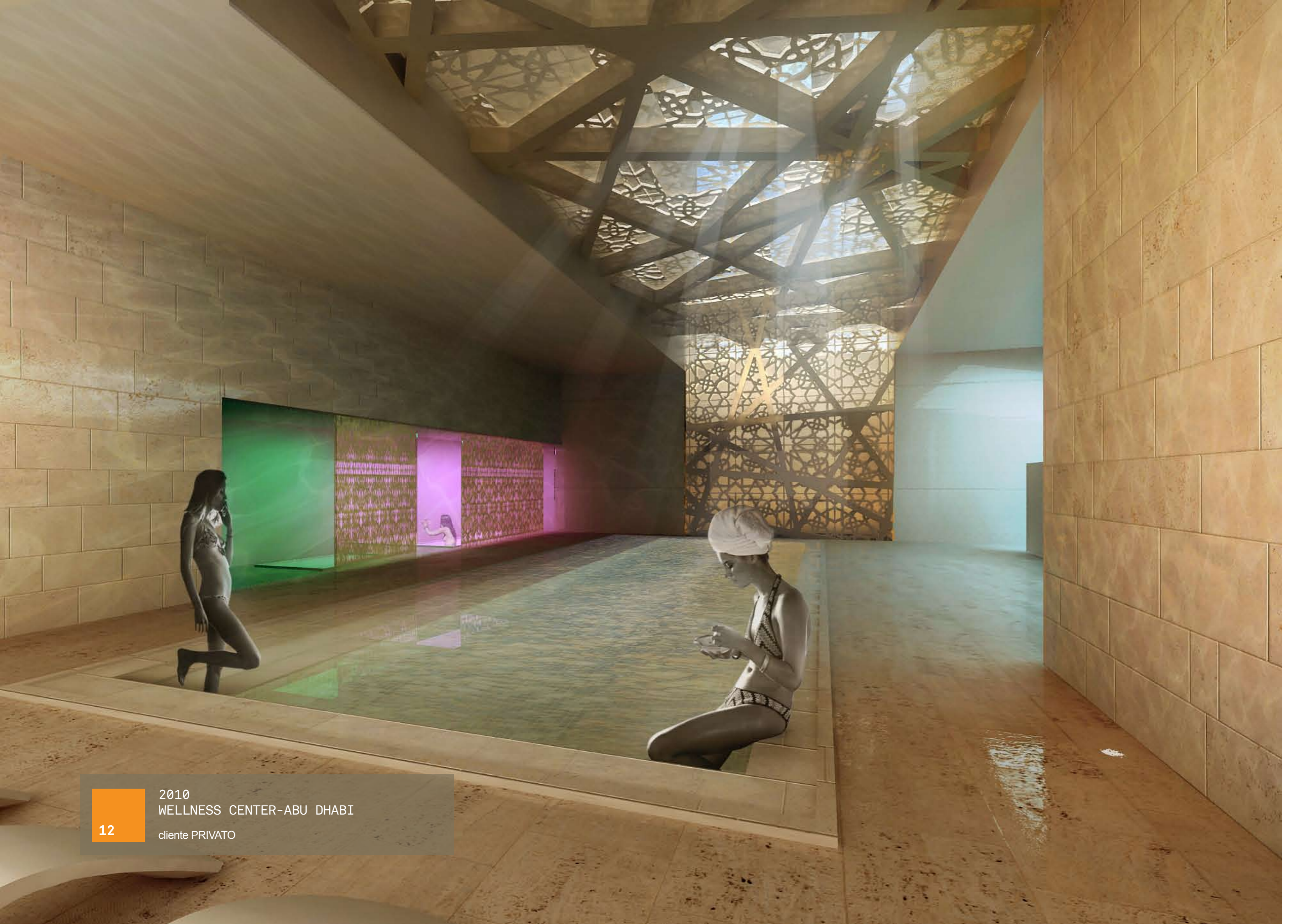
12 2010 WELLNESS CENTER-ABU DHABI cliente PRIVATO